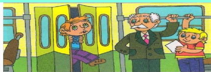
Не прислоняйся к дверям