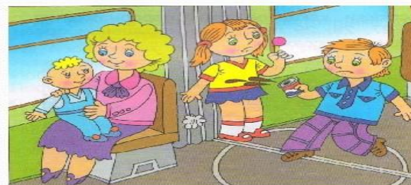
Не кушай в транспорте