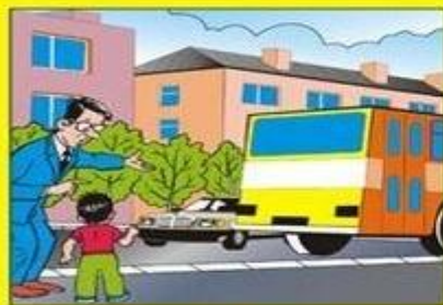
Опасно обходить автобус сзади!