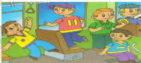
Держись за поручни