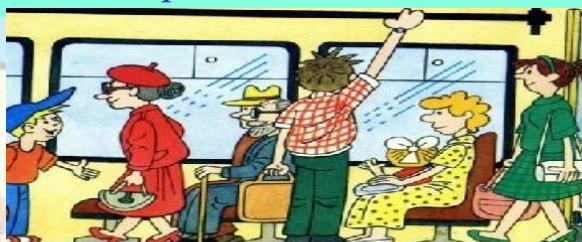
Уступи место старшим